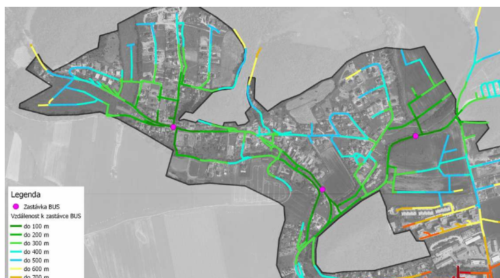
Modelování možných návrhů pro zlepšení dostupnosti autobusových zastávek v Levíně (zde ještě před známým návrhem řešení komunikací v poslední etapě na Lucberku), Na Horizontu a v Zahořanech